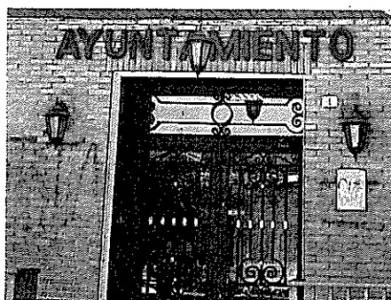
Fachada de un ayuntamiento.

Vistas las reestructuraciones que se nos vienen encima, qué probabilidad tiene un funcionario de carrera con catorce años de servicio que lo despidan -no por no cumplir sino, por un ERE municipal-? ¿Tiene derecho ese trabajador a alguna indemnización? Si un ayuntamiento fijó un salario hace cuatro años a un trabajador y ahora declara lesivo dicho salario, una cuantía que el